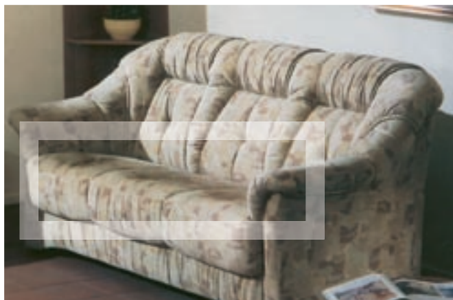
Reflets d'assise sur les revêtements en velours

D'une manière générale, chaque tissu de revêtement se décolore plus ou moins fortement sous l'effet du rayonnement direct du soleil. Les fibres synthétiques sont en général plus stables à la lumière que les fibres naturelles. Pour cette raison, il est recommandé de protéger votre salon capitonné des rayons directs du soleil de manière préventive. On peut fondamentalement partir du principe que tous les tissus autorisés par l'industrie sont soumis à un contrôle de stabilité à la lumière.