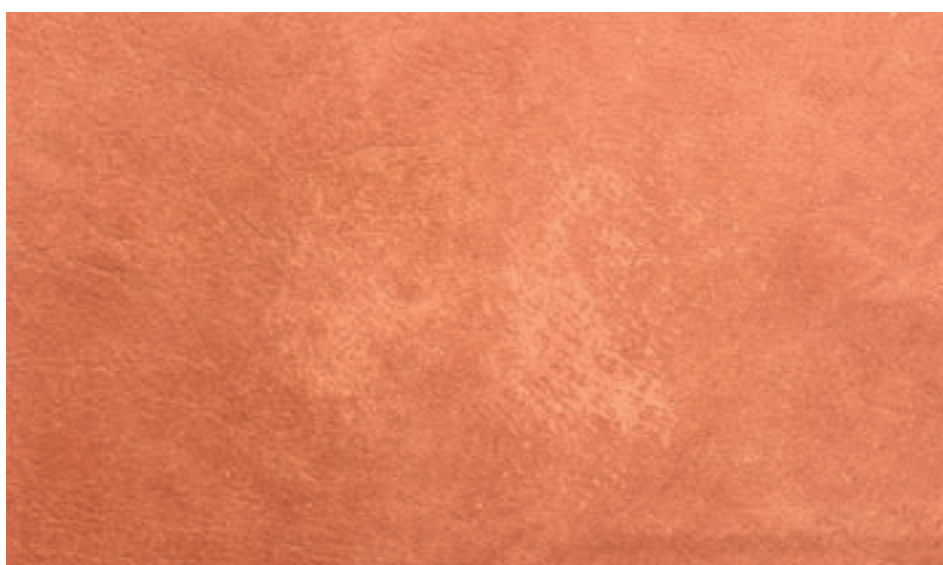
Taches de pigment

Une peau de cuir présente presque toujours de nombreuses caractéristiques naturelles. Celles-ci peuvent être créées par différentes blessures cutanées dans la vie d'un animal. Selon la situation, ces apparences résultent de piqûres d'insectes au pâturage, de