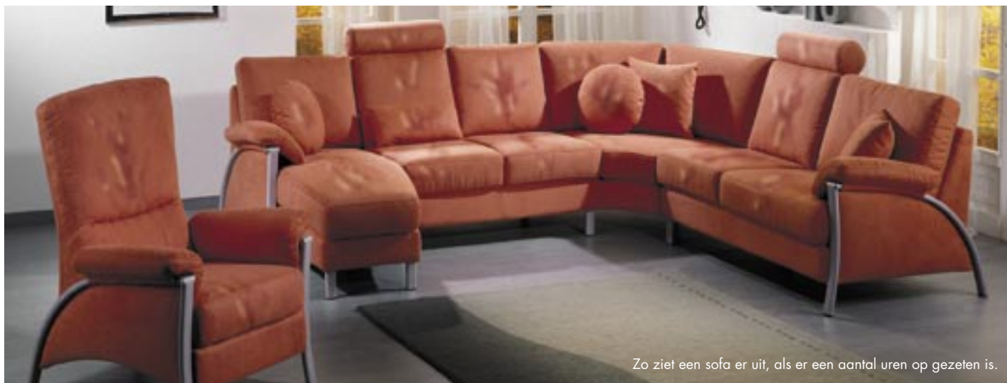
Zo ziet een sofa er uit, als er een aantal uren op gezeten is.

G eachte klant, gestoffeerde meubelen hebben afhankelijk van het model en uitvoering product- en modelgebonden eigenschappen, die ook tijdens het gebruik verschillende uitwerkingen kunnen hebben. In verband hiermee hebben wij als extra service voor u een „product-info“ gemaakt. Verder wensen wij u veel plezier met uw gestoffeerde meubelen.