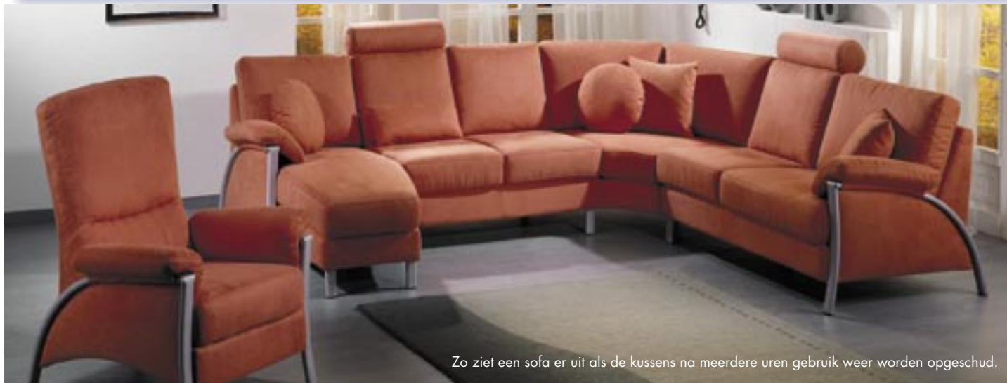
Zo ziet een sofa er uit als de kussens na meerdere uren gebruik weer worden opgeschud.

L osse rug- en zitkussens: Het woord „losse“ betekent, dat de kussens tijdens het gebruik verschuiven kunnen en telkens weer in de oorspronkelijke positie terug moeten worden gebracht. Het voordeel van deze vorm van stofferen is dat de kussens onderling verwisseld kun-